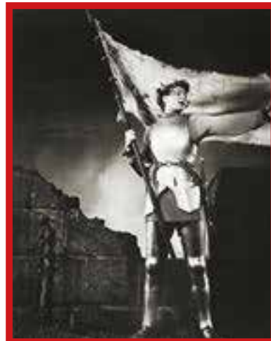
Vi besöker utställningen: "The rise and fall of Ingrid Bergman. And rise."

Vi träffas kl 10.30 på Centralstationen och åker gemensamt till Landskrona. Där besöker vi utställningen om Ingrid Bergman. "The rise and fall of Ingrid Bergman. And rise." Därefter går vi på Sveriges enda kolonimuseum.