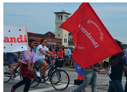
Verdandi i Malmöhus

Nej, tyvärr kan du inte det, men du kan söka "bostadstillägg" i stället. Bostadstillägget söker du genom pensionsmyndigheten. Kriterierna för att få bostadstillägg är att du måste ha fyllt 65 år