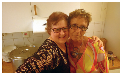
Verdandi i Trollhättan